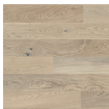
Moskus Parkett Storhaug Eik Hvit